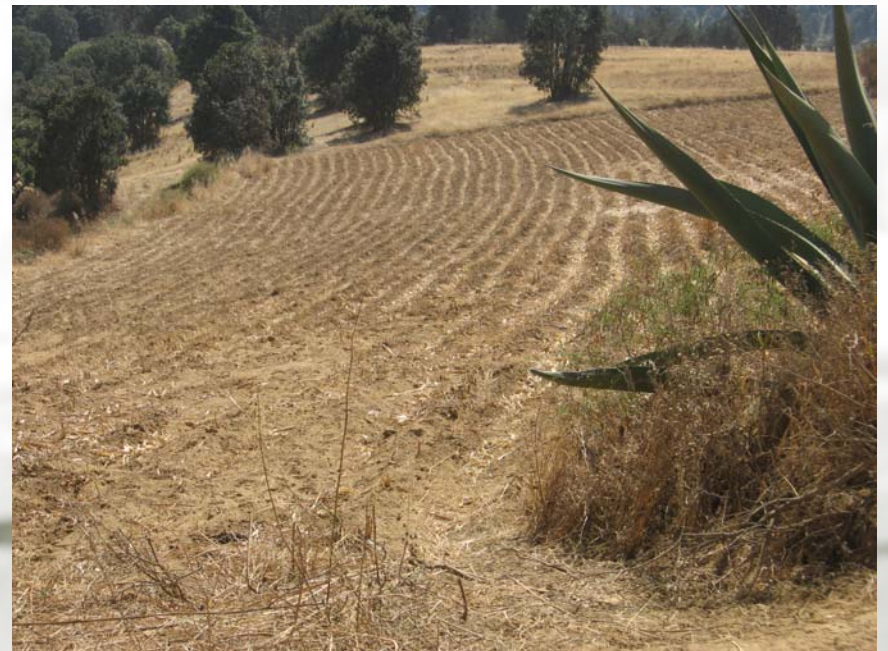
Santa Catarina del Monte